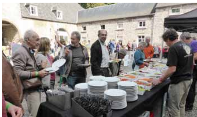
Un camion BBQ = un repas de pro !

jours de rencontre pendant lesquels de nombreux spéléos partagent des activités qu'ils aiment : spéléo dans des cavités peu accessibles le samedi puis, le dimanche, : projections, des stands dont Speleroc et la Librairie Speleo, des exposés, des formations. Avec en prime un apéro et deux repas de fête, le samedi soir et le dimanche midi.