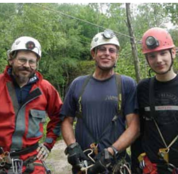
UN GROUPE...MAIS SURTOUT