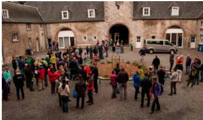
Ils attendent déjà l'apéro

La prochaine Fête des Spéléos se déroulera l'an prochain, le 3 e WE de septembre (16 & 17/9). Cette fois, nous veillerons à utiliser un site en français, plus pratique et plus clair. Les inscriptions seront prévues