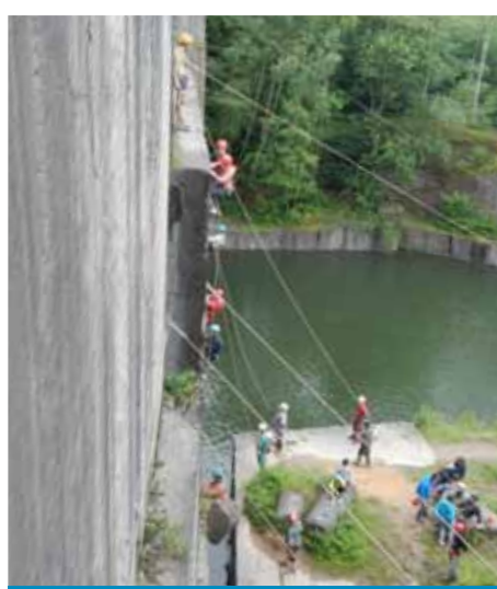
CELLE DE L'AVENTURE !