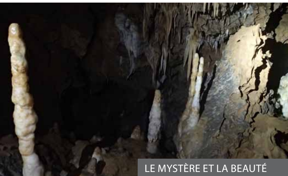
LE MYSTÈRE ET LA BEAUTÉ